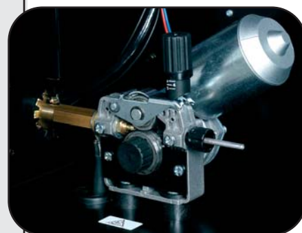
Stort drivhjul (Ø37 mm)