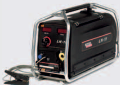
LN15 Portabelt matarverk (D200)