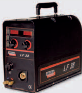
LF38 Portabelt matarverk (D300)